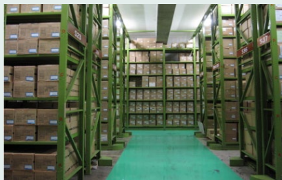
合通ロジOSセンター内観

書類保管_集荷・配達対応 (東京・首都圏) 書類保管_溶解処理・溶解証明書発行 (東京・首都圏) 書類保管_集荷・入出庫・配達・廃棄処理・ 書類保管_WEB管理システム (入出庫依頼・在庫照会) 書類保管_安心の取引実績_金融機関・流通企業