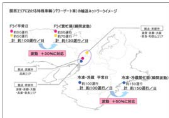
▲関西エリアにおけるパワーゲート車両の輸送ネットワークイメージ