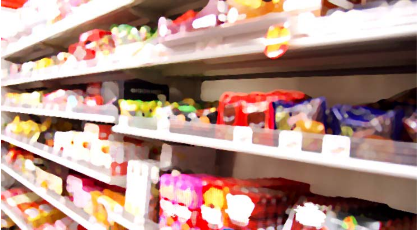
菓子配送のプラットフォーム